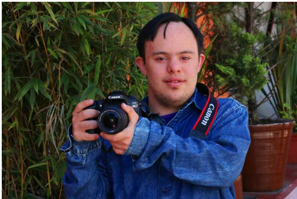
Luis trabaja como fotógrafo en el Congreso del Estado

A diferencia de otros empleos, Luis tiene que estar pendiente de los horarios que le den los diputados que lo contrataron, pues acude al Congreso de acuerdo con la agenda del día.