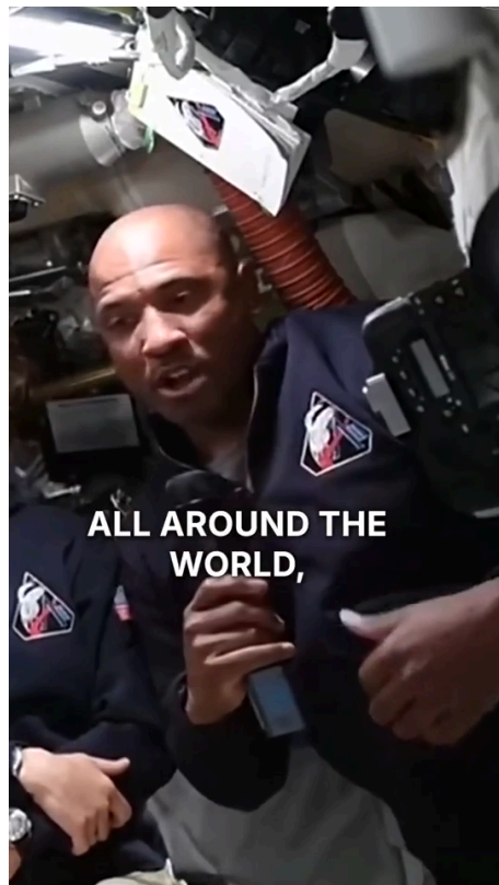
Victor Glover, piloto de Artemis II: "Quiero agradecer a Dios"