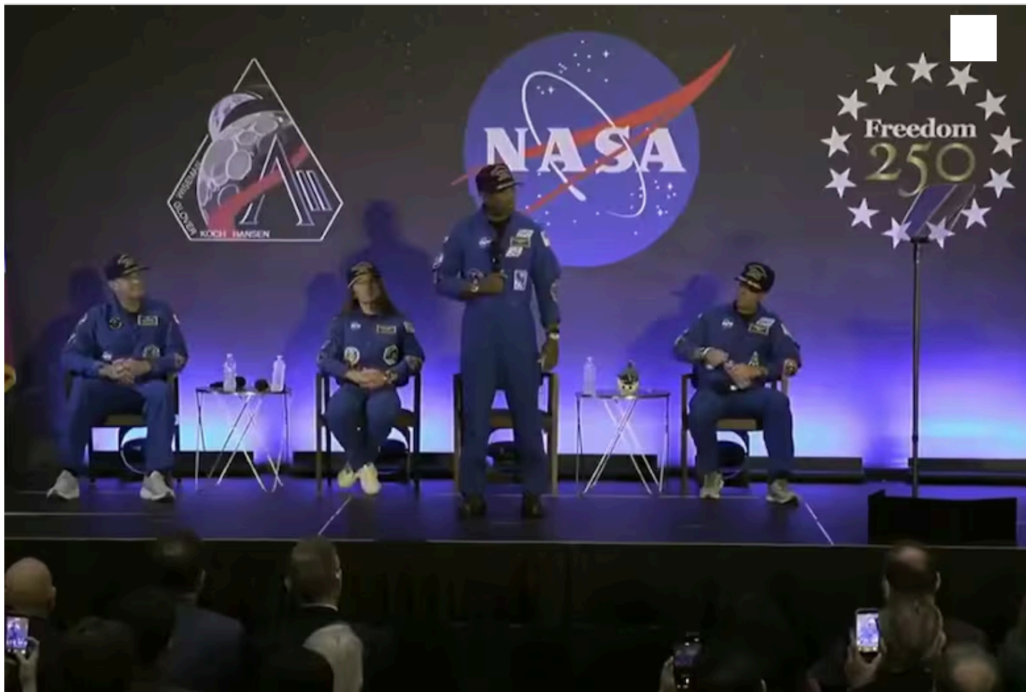
Glover emocionó a todos con sus declaraciones

La misión Artemis II marcó un paso clave dentro del programa Artemis de la NASA, ya que llevó a una tripulación de astronautas a orbitar la Luna antes de las futuras misiones que buscarán volver a posar seres humanos sobre la superficie lunar. Glover integró el equipo junto a Reid Wiseman, Christina Koch y Jeremy Hansen.