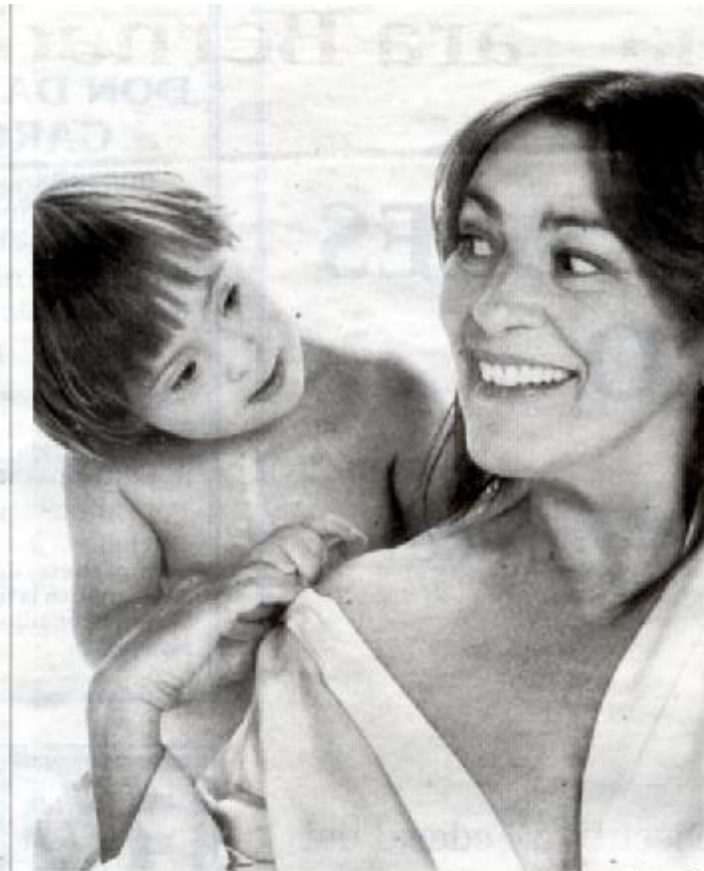
La actriz Carmen Maura con la pequeña Carmen son las protagonistas del mes de enero