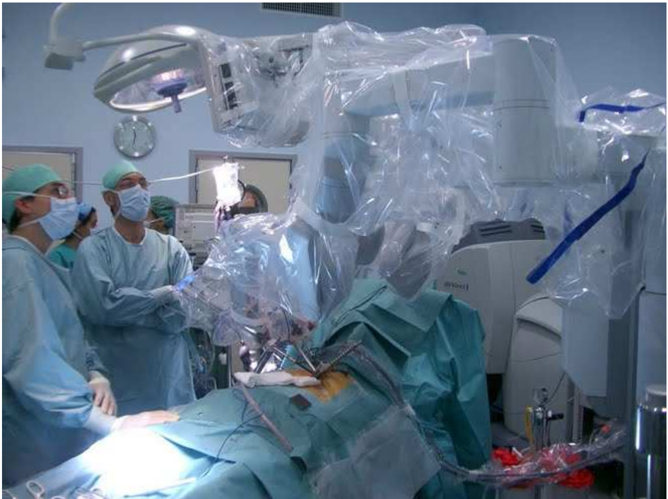
CIRUGÍA ROBÓTICA EN EL HOSPITAL CARLOS HAYA DE MÁLAGA( ESPAÑA)