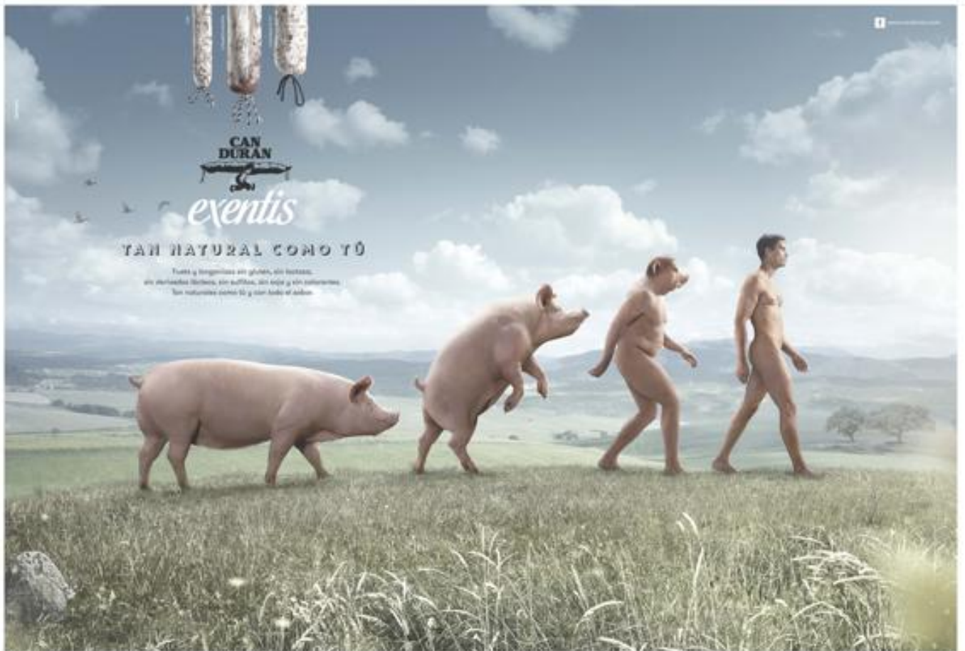
Primer premio: Can Duran

Una audaz modificación del clásico esquema de la evolución humana protagoniza el anuncio de la firma de alimentación Can Duran, realizado por la agencia Clarà Patrís, que ha recibido este jueves el primer premio de Publicidad Gráfica 2015 de La Vanguardia a la creatividad. El segundo clasificado es Banc Sabadell por su campaña Nuevos tiempos , diseñada por la agencia S,C,P,F..., en la que diferentes personas, como el tenista Rafa Nadal y su tío Miquel Àngel Nadal, conversaban sobre el futuro. El tercer premio ha sido para el Instituto Clavel de la Columna con un anuncio muy sencillo y efectivo al mismo tiempo, de la agencia SantaMarta&Astorga, en el que se limita a aconsejar a los lectores que les llamen cuando no puedan ir andando a comprar La Vanguardia .